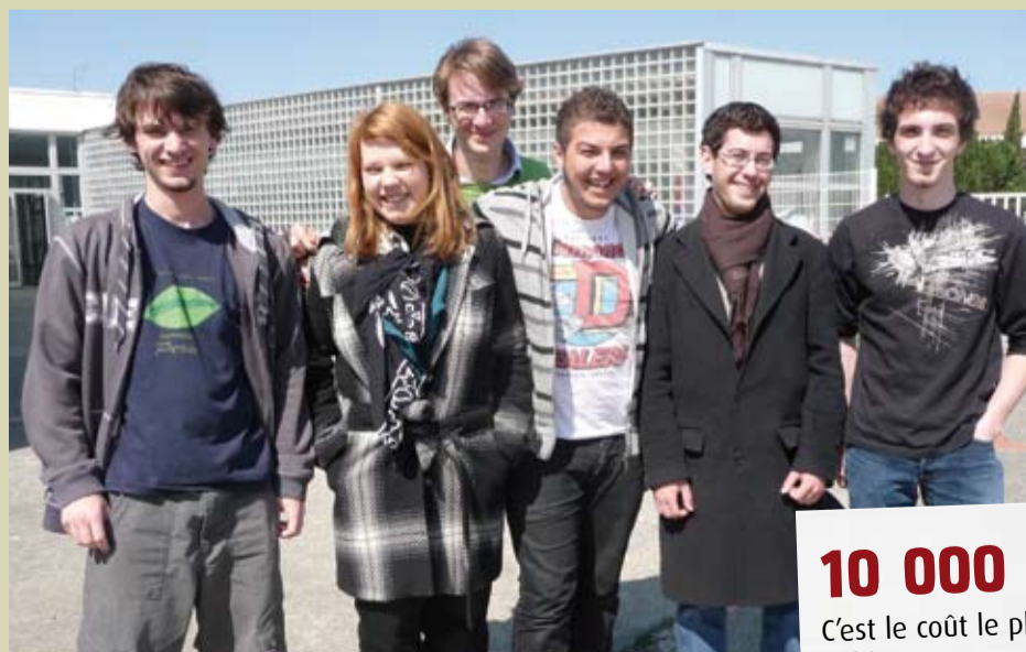
Le secret des organisateurs du lycée Riquet : la bonne humeur !

Un zeste d'organisation, une pincée d'idées, beaucoup d'envie, c'est la recette magique des élèves du lycée Riquet, près de Toulouse. Leur action ? Monter un concours de rock !