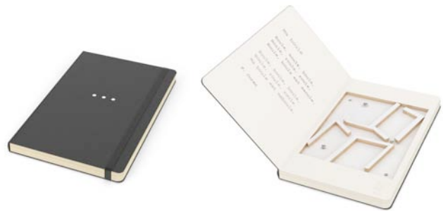
Wa.de.be designers 3 petites boules , 2010, Technique mixte sur carnet de croquis Moleskine, 13 x 21 cm