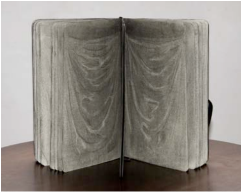
Guillaume Pinard, Rideau I , 2010 Fusain sur carnet Moleskine