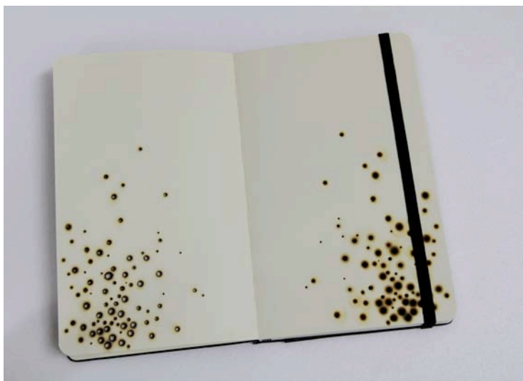
Vincent Mauger Sans titre , 2010 Carnet de croquis Moleskine perforé et brûlé, 13 x 21 cm