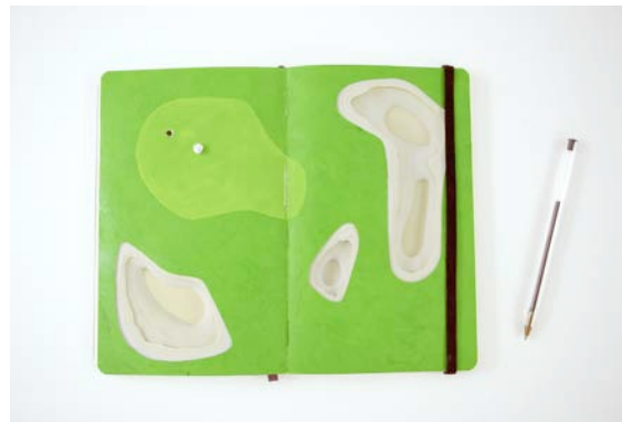
Mathieu Lehanneur, Tiny Golf , 2010 Gouache, papier, Moleskine