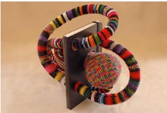
Joana Vasconcelos, Moleskina Contamina , 2010 Moleskine sketchbook, handmade knitting and crochet, polyester, polyurethane