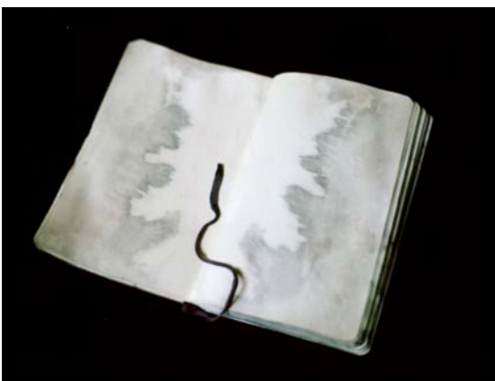
Estelle Hanania, The tide , 2010 Encre de chine sur carnet Moleskine