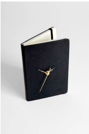
Katrin Sonnleitner Tic-tac-book , 2010