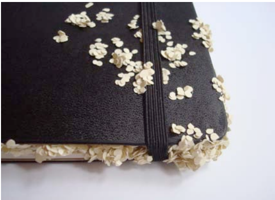
Ivana Brenner, Sans titre (détail) , 2010 Carnet Moleskine et technique mixte, 13 x 21 cm