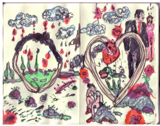
Philippe Perrot, Sans-titre , 2010 Crayon aquarelable et éosine sur carnet Moleskine Courtesy Galerie Art : Concept, Paris © Photo : X-MANH