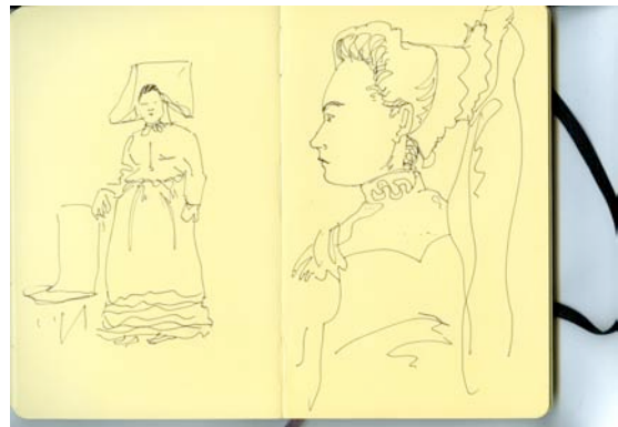
Stéphane Calais, Sans titre , 2010 Carnet Moleskine et technique mixte, 13 x 21 cm