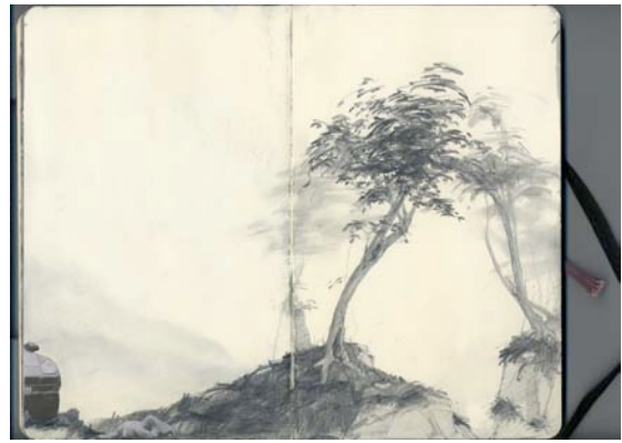
Guillaume Bresson, Sans titre , 2010 Crayon et collage sur carnet de croquis Moleskine, 13 x 21 cm