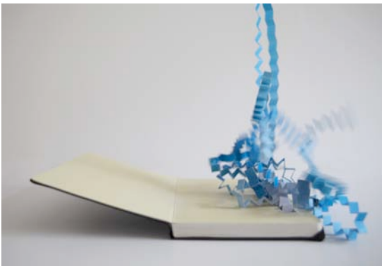
Constance Guisset Carnet bondissant , 2010